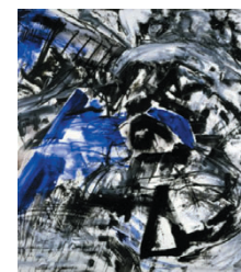
«Nell'alveo» (1982) di Emilio Vedova, una delle opere della mostra tedesca

La grande mostra antologica «Emilio Vedova 1919-2006» organizzata a Berlino dalla Berlinische Galerie con la Galleria d'Arte Moderna di Roma e la Fondazione Emilio e Annabianca Vedova, ha segnato un successo di interesse per l'artista veneziano. Un successo che avrà presto un seguito: è stato infatti concluso un accordo con il direttore del Padiglione d'Arte di Zagabria, Radovan Vukovic, per l'allestimento nella primavera del 2009 di un'antologica di Vedova, focalizzata in particolare sugli ultimi due decenni del suo lavoro. La mostra tedesca, che era