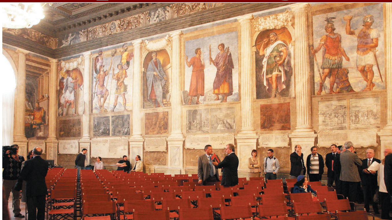
La Sala dei Giganti del Liviano, a Padova, riaperta dopo il restauro. Sotto, gli affreschi che raffigurano Petrarca e Costantino